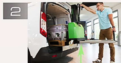
Puis il se soulève et se charge lui-même