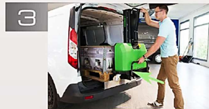
Les fourches et les bras sont placés sous la charge