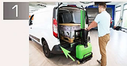
Il dépose une charge dans le véhicule