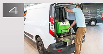
Et voilà! Tout est dans le véhicule