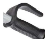
12337 Poignée Ergo avec garde de protection