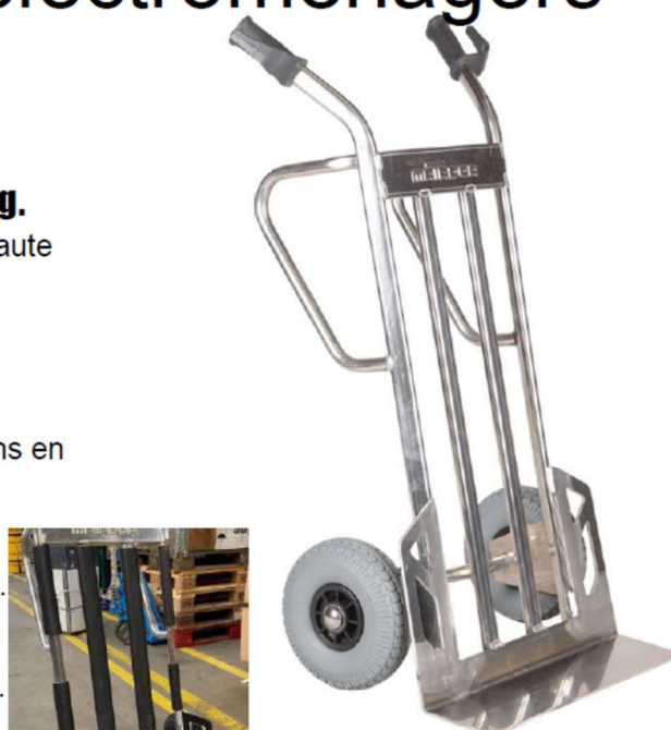
18834 M-NST500-CT ALUMINIUM

En option : protection en caoutchouc : (composé d'un dos ovale en caoutchouc (caoutchouc SEBS 70 ° Shore noir 6 mm d'épaisseur) et de capuchons de protection (amortisseurs cylindriques au-dessus de la Bavette)